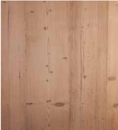
Fichte medium weiss